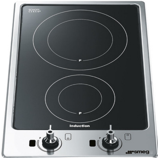
Table de cuisson, Esthétique: Classica, Induction, 30 cm, Type d'encastrement: Semi-affleurant